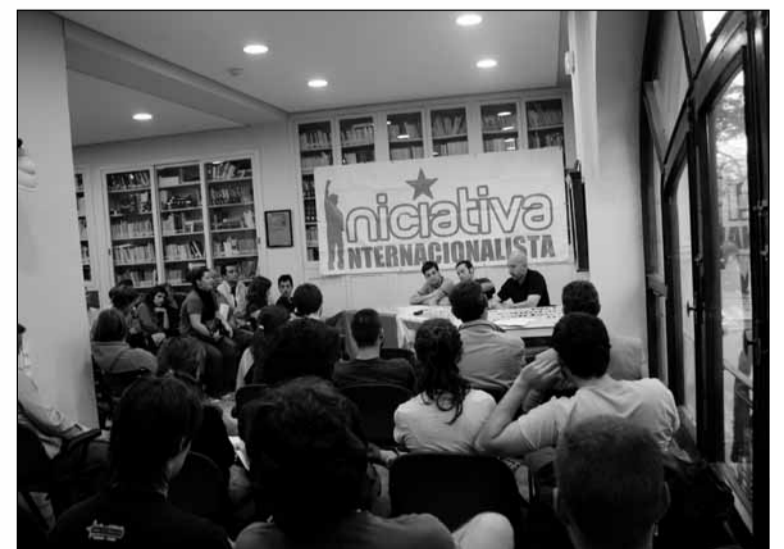
Els grups de suport a la candidatura Iniciativa Internacionalista no han deixat d'organitzar presentació, ni tan sols, quan la justícia espanyola amenaçava amb il·legalitzar-la. A la foto, la presentació de València